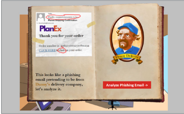
利用精选互动式训练模块吸引用户

超过 30 个互动式训练模块将教育用户特定威胁，如可疑电子邮件、凭据收割、密码强度和法规合规性。提供 9 种语言选择，最终用户将发现训练具有充分信息和趣味性；面对未来的现实攻击，您可安心：